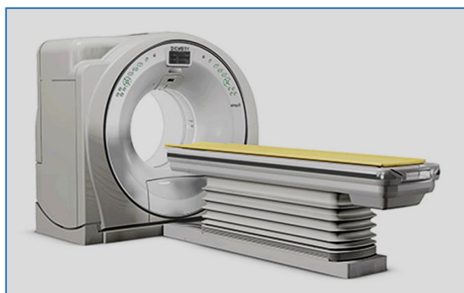
日立製作所製 16列マルチスライスCT装置